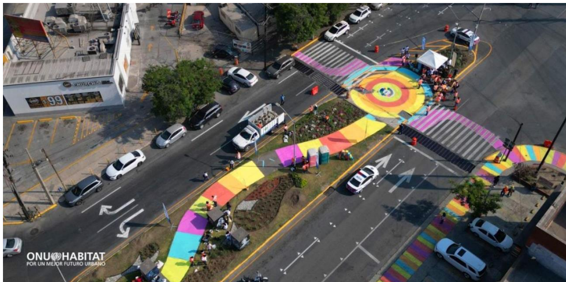
Imagen 2.- Urbanismo Táctico en San Nicolás de La Garza en El Estado de Nuevo León.