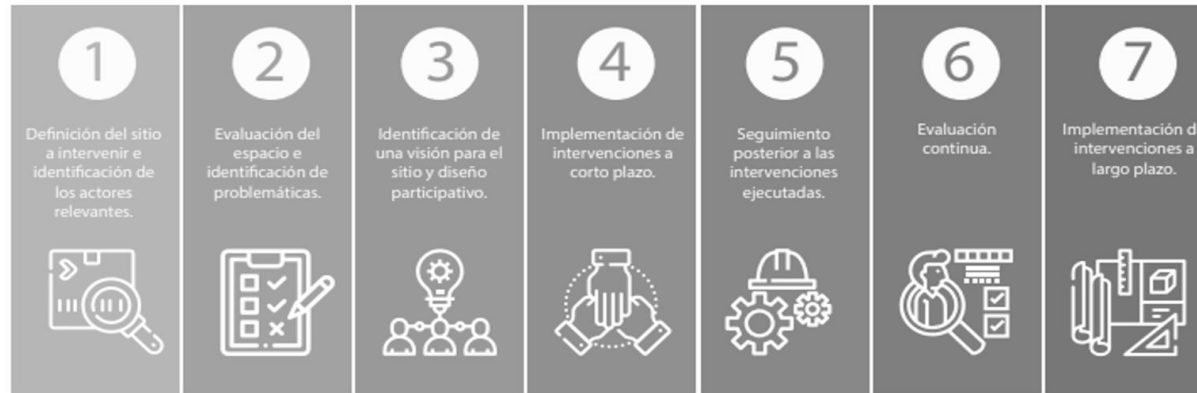
Imagen 3.- Transformación del espacio público a través de la metodología placemaking y mediante la implementación de intervenciones de urbanismo táctico.

Como parte de sus “Directrices sobre ciudades más seguras y asentamientos humanos de las Naciones Unidas” , incluye el Placemaking como base fundamental para las actuaciones que tienen como objetivo obtener ciudades más seguras.