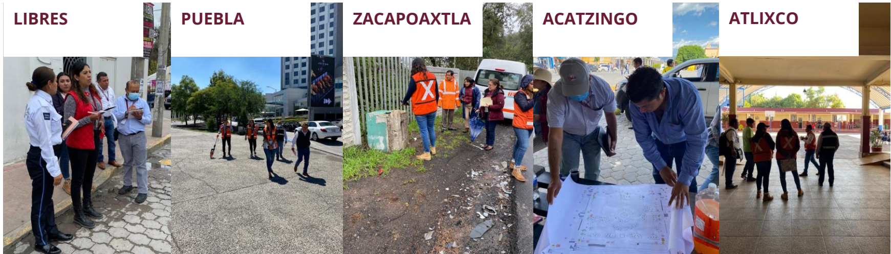
Imágenes 4, 5, 6, 7 y 8.- Reuniones con autoridades de los municipios de Libres, Puebla, Zacapoaxtla, Acatzingo y Atlixco.

En este sentido, un elemento indispensable de cualquier intervención de urbanismo táctico o placemaking es la participación y el involucramiento activo de la ciudadanía durante los procesos de diseño, implementación y seguimiento.