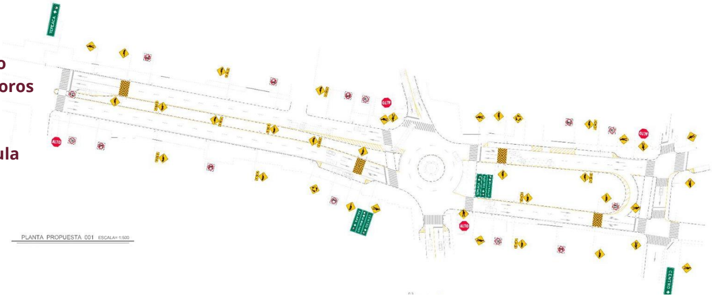
Imagen 10.- Proyecto de movilidad en Acatzingo.